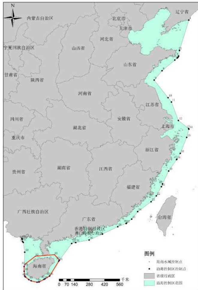
图1 沿海控制区范围示意图